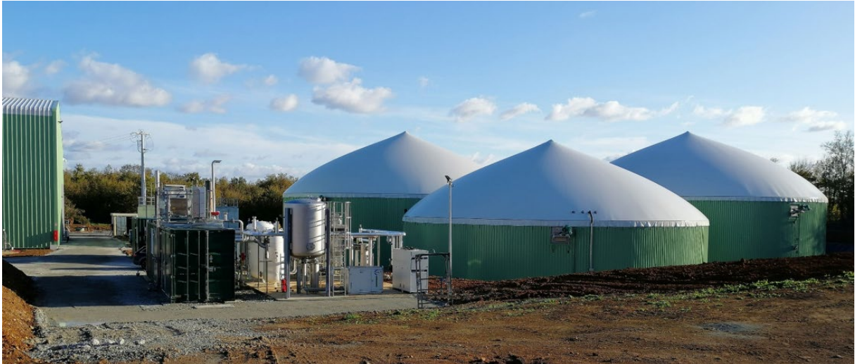
Exemple de projet similaire en France, à titre indicatif.